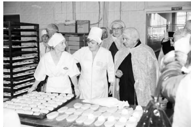
На хлебопечерном цехе Цивильского райпо участникам встречи представили процесс производства хлебопечерных и кондитерских изделий.

На заседании обсудили также вопросы развития социальной и мобильной инфраструктуры для малонаселенных пун-