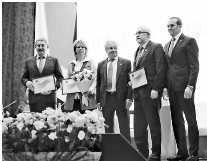
Во Всероссийском соревновании «За эффективное развитие отраслей деятельности» среди региональных союзов потребительских обществ за третий квартал 2018 года Чувашпотребсоюзу присуждено первое место за развитие общей деятельности.

ктов, систематизации закупок плодоовощной и дикорастущей пищевой продукции, создания многофункциональных оптово-распределительных центров, обеспечения качества и доступности кооперативной продукции.