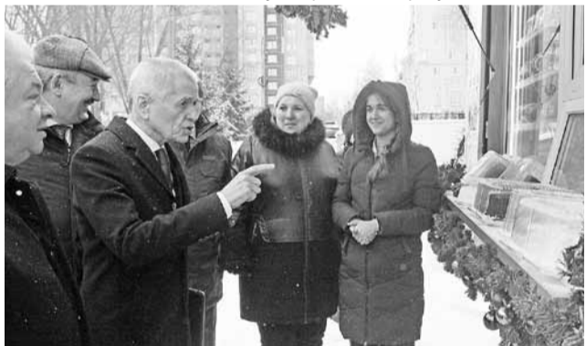
Первый заместитель председателя Комитета Государственной Думы Федерального Собрания Российской Федерации по образованию и науке Геннадий Онищенко знакомится с экспозицией потребкооперации.

Первый день расширенного заседания был посвящен знакомству с деятельностью Чебоксарской универсальной базы, а также Аликовского, Большесундырского, Моргаушского, Комсо-